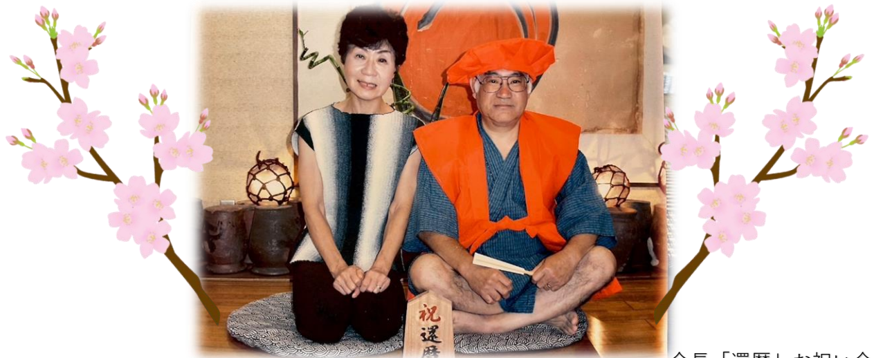
会長「還暦」お祝い会

お店に出られなくなった後は「最近見ないけど元気されてる？」など心配の声や「また会っておはなししたい」という声もよく頂きました。これだけ皆様にも思ってもらえる愛されていたすごい方だったと改めて知りました。私も少しでもそう思ってもらえるよう頑張りたいです。