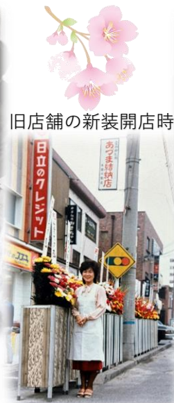
旧店舗の新装開店時