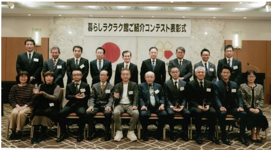
2023年上半年 暮らしラクラク館ご紹介コンテスト表彰式 2023年11月7日 於 ホテル日航大阪