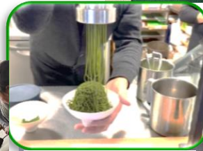
モンジェラン製作中